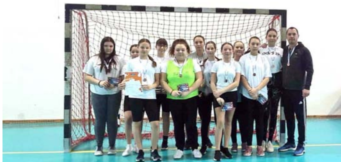
4. korcsoportos kézilabdásaink