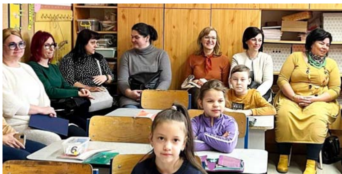
FOTÓK: ISKOLA ARCHÍVBUMA

Az óvodás gyerekek életében mindig izgalmas és nehéz időszak, amikor betöltik a hatodik életévüket és az óvodát elhagyva belépnek az iskolás éveikbe. Ennek az átmenetnek a megkönnyítése céljából alakult meg, sok-sok évvel ezelőtt, az Óvoda-Iskola átmenet munkacsoport, amely fontos feladatának tartja az óvodás gyerekek iskolai fejlődésének nyomon követését. Ebben az évben február 7-én, 8-án és 9-én került sor erre a szakmai találkozóra. A találkozón részt vevő óvodapedagógusok és tanítók az első évfolyam minden csoportjában egy magyar és egy matematika órát láthattak.